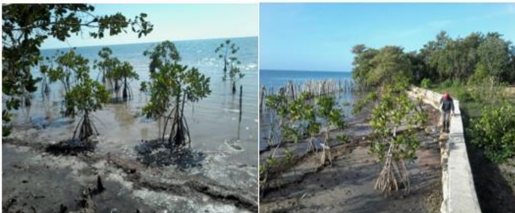
Fig. 3. Éxito de la reforestación de la especie Ryzophora mangle L. como resultado del proyecto empresarial.

En la siguiente figura, se muestran los avances de la reforestación de la especie Ryzophora mangle L., lo cual ha respondido a iniciativas de los lugareños en cuanto a la colocación de empalizadas en lugares donde el oleaje es más intenso. Ello ha favorecido al éxito de la reforestación de dicha especie, que en muchos sitios ha alcanzado el establecimiento.