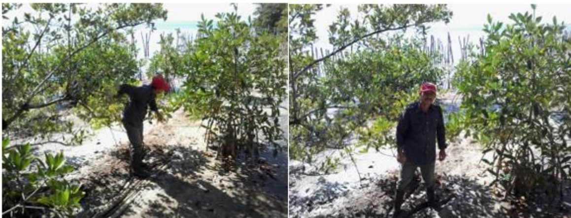
Fig.5. Establecimiento de Ryzophora mangle previa rehabilitación hídrica

comunidad, organismos involucrados y expertos en el tema, y quedó conformado el proyecto que incluye la realización de canalizaciones, zanjas y limpieza de esteros (ver anexo). Obsérvese el éxito de la reforestación de Ryzophora mangle en lo fundamental.