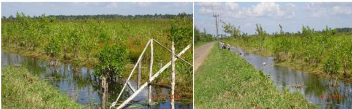
Fig.4. Proyecto de rehabilitación hídrica mediante canalización

Se elaboró el proyecto de rehabilitación hídrica que se puso en marcha y se construyó el canal para favorecer la rehabilitación hídrica de la zona, el cual llega al manglar, con un intercambio más refrescante y favorecido (Ver figura 4).